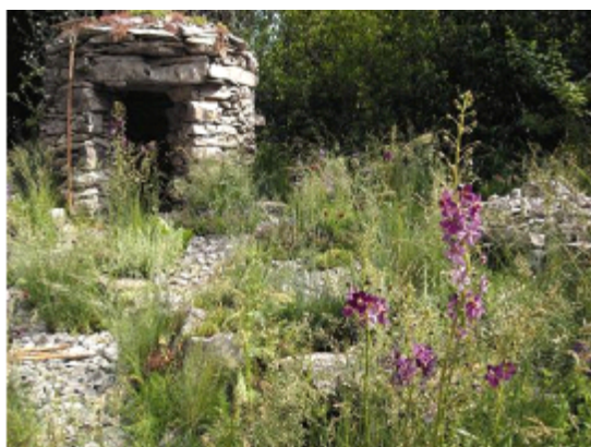
Foto: Pepina zgodba – kamnito pastirsko zavetišče