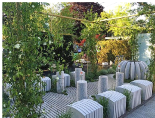
Vodna postaja Pepe s Krasa

Leta 2012 sta na njej nastopila v kategoriji »Artisan Gardens« s kamnitim pastirskim zavetiščem, poimenovanim Pepina zgodba, ki ga je oblikoval Benedek. S stvaritvijo je osvojil drugo mesto. Kraševca sta se udeležila tudi lanske razstave, na kateri sta ponovno dosegla drugo mesto, tokrat v kategoriji »Fresh Garden«, vrtov, v katerih se zrcalijo nove zamisli.