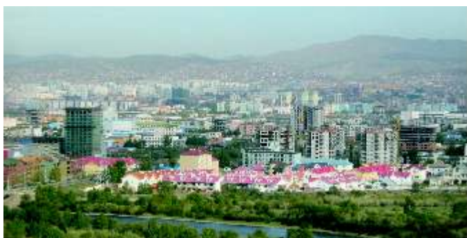
Tretjina prebivalcev Mongolije živi v glavnem mestu Ulan Bator.

Mongolija je ekonomsko bistveno bolj liberalna od svojih sosedov v osrednji Aziji in tudi od številnih drugih tranzicijskih držav. Na ra un demokratizacije in reform za vzpostavitev tržnega gospodarstva je ve kot 80 % mongolskega gospodarstva v zasebni lasti, medtem ko so imeli še leta 1990 samo družbena podjetja. Mongolija se kljub visoki gospodarski rasti v zadnjem desetletju (pred dvema letoma so imeli 7 % rast) še vedno soo a s posledicami donedavnega centralno planskega gospodarskega sistema in ostaja ena najrevnejših držav na svetu. Leta 2007 je bruto družbeni proizvod (BDP) na prebivalca znašal le 3.222 USD. V Sloveniji je na primer istega leta ta presegal 27.200 dolarjev.