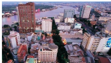
Hanoi, glavno mesto Vietnama

Leta 2007 je Vietnam vstopil v Svetovno trgovinsko organizacijo (STO), kar je spodbudilo izdatno povečanje obsega neposrednih tujih naložb. Te so samo leta 2007 presegle mejo 20 milijard dolarjev. Z vstopom v STO se je močno razvil tudi tekstilni sektor , ki zaposluje dva milijona ljudi oziroma četrtno vseh zaposlenih v industriji.