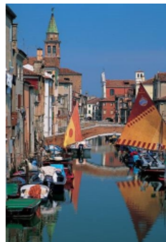
Chioggia, Beneška laguna

Beneška obalna pot povezuje letoviška mesta s peš enimi plažami, nazadnje pa pripelje do znamenitih Benetk. Vzdolž reke Brente prispe do Padove, vije se ob vznožju Evganejskih gri ev z znanimi termalnimi središ i vse do Chioggie, nekateri jih imenujejo male Benetke.