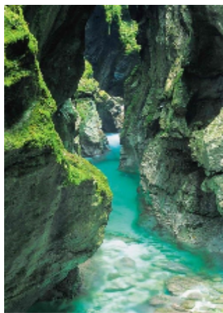
Tolminska korita

Trasa Adriabike povezuje zahodno Slovenijo s severovzhodno Italijo. Zacenja se ob vznožju Julijskih Alp, v italijanskem Trbižu, obdanem s prostranimi zelenimi gozdovi in cudovitimi Belopeškimi jezeri, v katerih odsevajo okoliški vršaci. Skozi mesto vodi še druga kolesarska pot Alpe-Adria, ki poteka od severa proti jugu, iz Salzburga do Gradeža. Adriabike se iz Trbiža nadaljuje po trasi nekdanje železniške proge Ljubljana-Trbiž do Ratec in Kranjske Gore, ki ni zanimiva le pozimi, ko zapade sneg. Sava Dolinka popelje kolesarja mimo širnih travnikov z lesenimi kozolci vse do Bleda. Sledi vožnja z vlakom po Bohinjski proggi do Mosta na Soci. Zgornja in Spodnja soška dolina ponujata obiskovalcu neokrnjeno naravo precudovitih barv, med katerimi se zagotovo najbolj vtisne v spomin smaragdna barva reke Soce. Ta vabi prav do svojega izvira v dolini Trente.