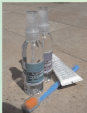
za osebno higieno in nego