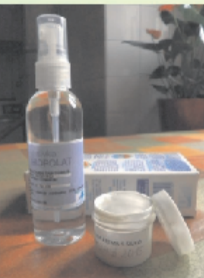
za izdelavo naravne kozmetike