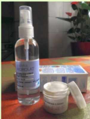
za izdelavo naravne kozmetike