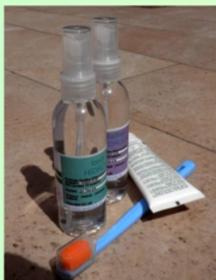
za osebno higieno in nego