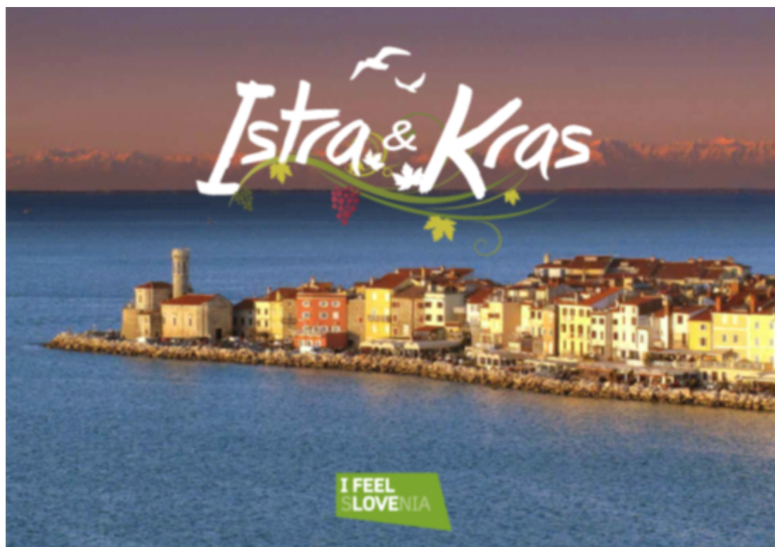
FOTO: Brošura Obalno-kraške regije, ki bo prvič predstavljena na EXPO Milano 2015

Obalno-kraška regija se bo predstavila na svetovni razstavi EXPO v Milanu, ki bo potekala od maja do oktobra letos. V državnem paviljonu bo nastopila kot prva med slovenskimi regijami od 1. do 15. maja. Predstavitev regije bo dopolnjeval slogan predstavitve Slovenije, saj se tudi sama prepozna v besedah ZELENA. AKTIVNA. ZDRAVA. Posebej za to priložnost bo izdana prva regijska turistična brošura.