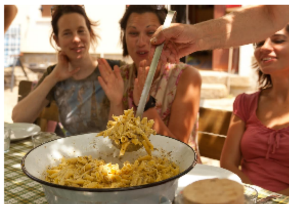
Fuži s tartufi

Njihovo ponudbo si lahko ogledate na spletni strani www.istraterra.com , kjer so objavljeni predlogi za izlete, sledite jim na Facebook profilu, lahko pa jih tudi pokli ete po telefonu 068 618 649. Spletno stran bodo jeseni nadgradili z razširjeno ponudbo. Njihovi katalogi so dostopni v turističnih informacijskih centrih. Bolje pa jih boste lahko spoznali tudi na jesenskih lokalnih dogodkih, npr. v asu Evropskega tedna mobilnosti in Svetovnega dne turizma.