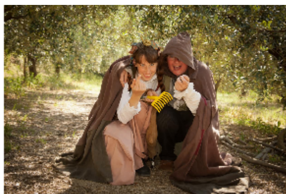
V olj niku; foto: Istra Terra

V Istra Terri si prizadevajo povezovati turistične akterje v zaledju ob upoštevanju na el odgovornega turizma kot generatorja razvoja, ki ohranja lokalno okolje. Vižintinova pri tem poudarja, da se povezujejo s turistinimi ponudniki, ki se želijo razvijati, a hkrati ohranjati in varovati naravno in kulturno dediš ino ter prispevati k njeni valorizaciji in lokalnemu razvoju ruralne Istre. V podjetju širijo dobre prakse na podro ju odgovornega turizma, zato izobražujejo skupnost, spodbujajo povezovanje in sodelovanje ter dvigujejo ozaveš enost okolja o nujnosti ohranjanja dediš ine.