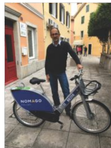
Foto: Razprava o regionalni trajnostni mobilnosti obalno-kraške regije 22.5.2019