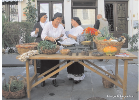
Utrinek iz Dnevov kulturne dedišine, oktober 2016:

Organizirajo sejme starin in domače obrti v Piranu, izvajajo študijske krožke restavratorstva, pletenja košar na tradicionalen, istrski način, izdelave mozaikov, ujenja kaligrafije. Pripravljajo številne tematske razstave, povezane s prazniki in obujanjem starih običajev. Člani društva želijo spodbuditi k aktivnemu preživljanju prostega časa tudi otroke in mlade. Na Županovi rojstni dan v januarju prirejajo delavnice za najmlajše, mlade pa vzgajajo za prostovoljstvo. Redno sodelujejo tudi na občinskih prireditvah. Na minulem aprilskem solinarskem prazniku so obiskovalcem odprli vrata svojih prostorov na Tartinijevem trgu, da so si lahko ogledali domiselne ročno narejene izdelke in okraske. Anbotovci se od leta 2004 udeležujejo tudi Dnevov evropske kulturne dedišine v Piranu. Lanskega oktobra so v njihovem okviru pripravili vodeni sprehod po piranskih trgih, ki so ga poimenovali Se dobimo na "pjaci" .