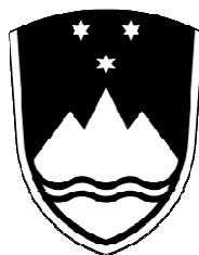
Črno-beli grb (varianta 1)