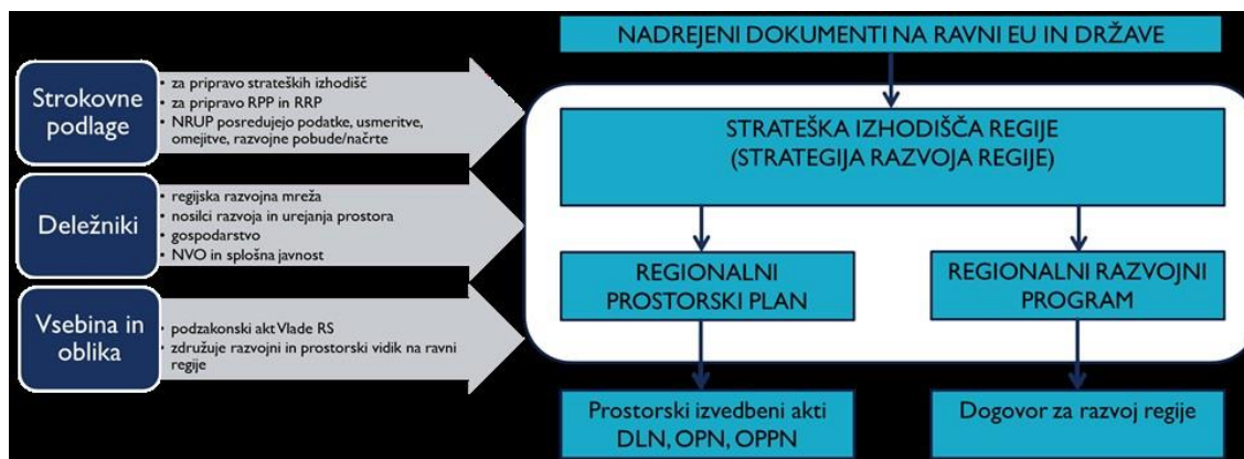
Model povezovanja prostorskega in razvojnega načrtovanja na regionalni ravni

Novi model povezovanja na regionalni ravni naj bi podprl doseganje sinergijskih učinkov s pripravo integralnih projektov, s tem pa k večji učinkovitosti pri izvajanju trajnostnega razvoja. V okviru CRP projekta je bila predlagana priprava skupne Strategije razvoja regije kot dokument, v katerem se na podlagi analize, strateškega razmisleka in vključitve vseh ključnih udeležencev na participativen način določi vizijo in cilje razvoja ter način, kako jih dosegati. Regionalni razvojni program (RRP) in RPP pa sta dokumenta, ki na podlagi predhodno pripravljene Strategije razvoja regije določita ključne izvedbene korake in prostorske danosti, kako naj regija doseže zastavljene cilje razvoja.